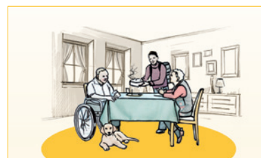
Servizi di supporto