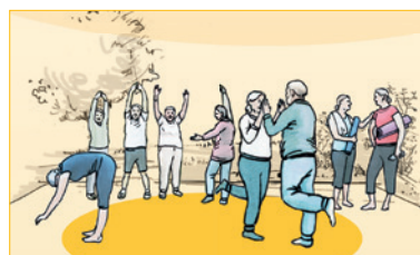
Promozione del movimento e prevenzione delle cadute